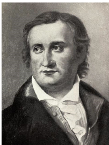
Thomas Johann Seebeck (1770-1831)

Il suo primo interesse fu lo studio della luce e divenne il più stretto consigliere di Johann Wolfgang von Goethe (1749-1832) nell'analisi dei colori;