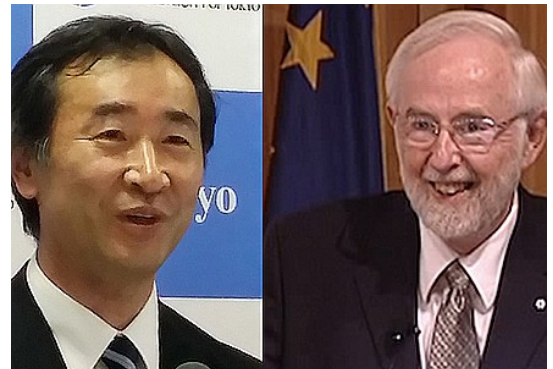
Takaaki Kajita, fisico giapponese dell'Osservatorio Super-Kamiokande (Super-K) e Arthur B. McDonald, fisico statunitense del Sudbury Neutrino Observatory (SND).

A questo punto, dire che un neutrino oscilla, non vuol dire che esso si muova come il sediolino di un'altalena. Cosa invece oscilla, cioè varia periodicamente, è una proprietà fondamentale del neutrino, il suo cosiddetto «sapore». Il sapore, (nonostante il nome evochi un'associazione con il gusto) è una proprietà generale del neutrino che, nell'analogia dei Lego, potrebbe essere paragonata al colore di ciascun mattoncino. Così come i neutrini possono solo essere di tre sapori ( elettronico , muonico e tauonico ), possiamo immaginare che i mattoncini Lego dell'Universo che corrispondono ai neutrini possano essere solo di tre colori, per esempio rossi , verdi e blu . Bene: scoprire allora che il sapore dei neutrini oscilla