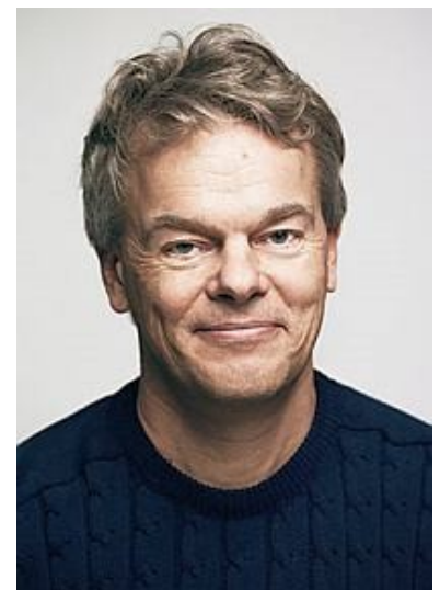
Edward I. Moser (1962-...) - Norwegian University of Science and Technology (NTNU), Trondheim, Norway