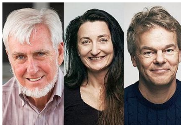
John O'Keefe (1939-...), University College di Londra, May-Britt Moser (1963-...) e Edward I. Moser (1962-...), Università di Trondheim ,

Esse agiscono – si è poi scoperto – realizzando una mappa cognitiva in grado di rappresentare una specifica posizione nello spazio con un meccanismo diverso (anche se talvolta complementare e integrato) da quello sviluppato da altre aree cerebrali,