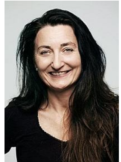
May-Britt Moser (1963-...) - Norwegian University of Science and Technology (NTNU), Trondheim, Norway

Questi dati sperimentali hanno aperto, negli ultimi anni, importanti prospettive in ambito clinico. Diversi studi in animali da laboratorio hanno dimostrato come l'esposizione cronica all'etanolo sia in grado di alterare sia la memoria spaziale a lungo termine sia di provocare gravi deficit nei compiti di apprendimento ambientale.