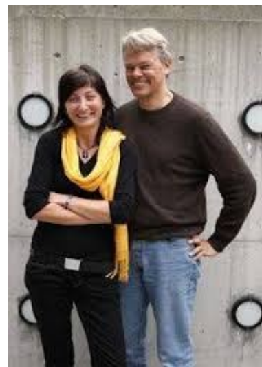
I coniugi norvegesi May-Britt e Edward I. Moser dell'Università di Trondheim.

(Neurochirurgo e Storico della Medicina e della Sanità, Direttore del Centro studi sulla storia del pensiero biomedico, Università degli studi di Milano Bicocca. vittorio.sironi@unimib.it )