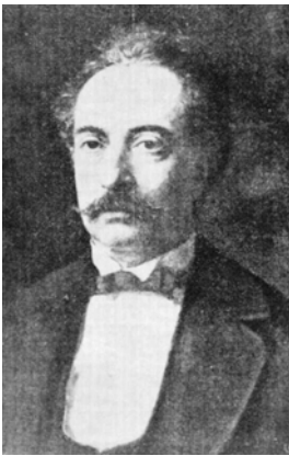
Eugenio Beltrami (1835-1900)

Come è noto, questa procedura è stata seguita da Eugenio Beltrami il quale ha costruito, con gli strumenti della geometria differenziale, un modello di geometria non euclidea, dimostrando così che i postulati di quest'ultima sono compatibili, e di conseguenza dimostrando anche che il postulato euclideo della parallela non può essere dimostrato a partire da quelli che lo precedono nella trattazione classica. È pure noto che sono stati dati anche altri modelli di geometria non-euclidea, per esempio fondati sulla geometria proiettiva. Analoga procedura segue per esempio David Hilbert (1862-1943), nei suoi Fondamenti di geometria , esibendo via via modelli dei suoi sistemi di postulati, costruiti con elementi di certi campi numerici. Una riflessione ulteriore potrebbe portare a osservare che questa procedura si fonda sostanzialmente sulla presunzione che la realtà, dalla quale prendiamo gli elementi per costruire i modelli, sia coerente in se stessa. Se poi questi elementi sono presi da altri capitoli della matematica, è chiaro che in questo modo viene presunta la coerenza dei capitoli stessi. Pertanto la soluzione del problema di compatibilità che così si offre è soltanto parziale e, per così dire, provvisoria. Ma se non altro, essa indica una sostanziale unità della problematica della scienza, unità che riconduce in ogni caso ai problemi fondamentali della struttura e del significato della nostra conoscenza. ❖