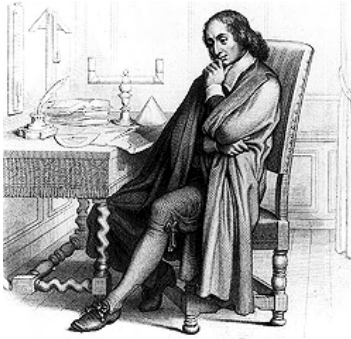
Blaise Pascal (1623-1662)

peso se si immaginano le sue dimensioni aumentate sopra ogni limite. Quindi per esempio i paesi incontrati dal viaggiatore Gulliver nei viaggi immaginari descritti dallo scrittore irlandese Jonathan Swift non possono esistere nella realtà; in particolare le ossa dei giganti del paese di Bronignag si romperebbero sotto il peso dei loro corpi. Analoghe considerazioni possono essere fatte a proposito delle fantasie elaborate dal matematico, filosofo e teologo francese Blaise Pascal; questi, in una celebre pagina, per mostrare la grandezza e la miseria dell'uomo, immagina che mondi simili al nostro universo possano esistere in una sola goccia del sangue di un piccolissimo insetto. Anche in questo caso si può dire che la fantasia ha condotto troppo lontano la mente del grande matematico perché le leggi della natura impediscono l'esistenza reale di mondi che sono la pura e semplice riduzione o ingrandimento geometrico del nostro.