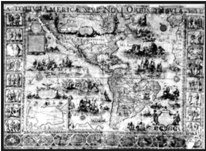
Willelm Blaeu, Carta dell'America (XVII secolo), Università di Bologna, Museo delle Navi

Consideriamo il primo senso in cui viene presentato e utilizzato il concetto di modello nella tecnica e nella scienza. Si potrebbe dire che si tratta di un comportamento del tutto naturale da parte del ricercatore o del tecnico; tuttavia è utile riflettere sulle ipotesi, spesso non coscientemente analizzate e non esplicitamente enunciate, sulle quali si basa l'impiego del modello in questo primo caso. Infatti, in questa prima accezione, il modello viene considerato come un sistema materiale che ha, per qualche buona ragione, degli aspetti in comune con un altro sistema materiale che si vuole conoscere; in forza di questa analogia o similitudine tra i due sistemi, le osservazioni o le misure fatte su uno di essi vengono assunte come base per trarre delle informazioni sull'altro dei sistemi materiali. Si pensi per esempio a ciò che si fa abitualmente nelle gallerie del vento per i modelli di aerei, o nelle vasche navali per i modelli di navi. La resistenza che