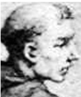
Edme Mariotte (1620-1684)