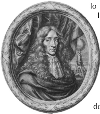
Robert Boyle (1627-1691)

È interessante tuttavia osservare che la relazione precedente non rappresenta il comportamento del gas per ogni valore di p e di V . Infatti, quando il gas abbia una temperatura abbastanza bassa, inferiore a una temperatura chiamata «critica», il suo comportamento, al diminuire del volume, segue questa legge soltanto fino a che si sia rag-