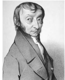
Amedeo Avogadro (1776-1856)

Ovviamente queste rudimentali enunciazioni ritraggono soltanto una situazione schematica e astratta: nella realtà concreta l'adozione dei metodi quantitativi, per la descrizione della realtà e per la formulazione delle ipotesi, rende sempre possibile l'esistenza di margini di approssimazione e di errori di misura. Ne consegue che spes-