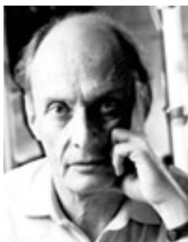
Paul Greengard (1925 - ) Nato a New York, ha studiato a Baltimora, a Cambridge e a Bethesda. Dal 1983 dirige il Laboratorio di Molecular and Cellular Neuroscience alla Rockefeller University di New York.

mento motorio. Le sue ricerche hanno portato a capire che i sintomi del morbo di Parkinson sono legati a una mancanza di dopamina nei gangli basali: la somministrazione di L-dopa può attenuare le conseguenze della malattia. Scoperte successive hanno dimostrato che i farmaci usati per il trattamento della schizofrenia modificano la trasmissione sinaptica bloccando i recettori della dopamina contribuendo allo sviluppo di una nuova generazione di farmaci antidepressivi.