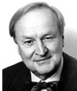
Arvid Carlsson (1923- ) Nato a Uppsala, in Svezia. Dal 1989 è Professore emerito di Farmacologia all'Università di Göteborg, Svezia.

Alla fine degli anni Cinquanta Arvid Carlsson ha scoperto che la dopamina (fino ad allora ritenuta solo il precursore della noradrenalina) è un neurotrasmettitore implicato nel controllo del comporta-